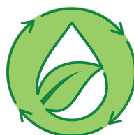
Consumo Idrico Ridotto