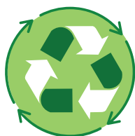
Materiale e imballaggio riciclabile

Firmato a nome e per conto del produttore/distributore: