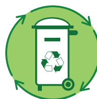
Riduzione dei rifiuti