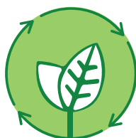
Contenuti di riciclato