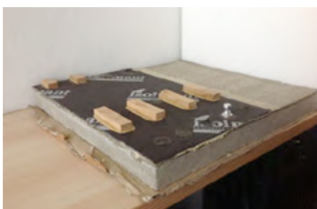
B) Provini per prove di shear su parquet incollato e provini per prove di strappo ("test dolly")