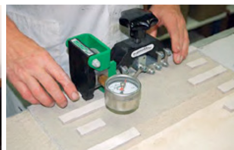
C) Prova di shear mediante apposita strumentazione (Pressometer - misuratore idraulico di forza di taglio)

AVVERTENZE: La presente scheda tecnica non costituisce specifica e, se composta da più pagine, accertarsi di aver consultato il documento completo. Le indicazioni riportate sono frutto della nostra migliore esperienza attuale ma rimangono pur sempre indicative. Sarà cura dell'utilizzatore stabilire se il prodotto è adatto all'impiego previsto, assumendosi ogni responsabilità derivante dall'uso del prodotto stesso.